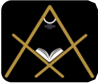
Logo AOP, Estefanía Sánchez

No podíamos dejar de hablarles de uno de nuestros proyectos en marcha más distinguidos: el montaje de “Un escáner abierto” (AOP, por sus siglas en inglés). Pero, espera ¿Cómo se come ésto?